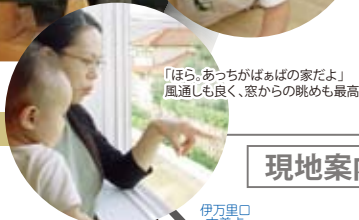
「ほら、あっちがばあばの家だよ」 風通しも良く、窓からの眺めも最高