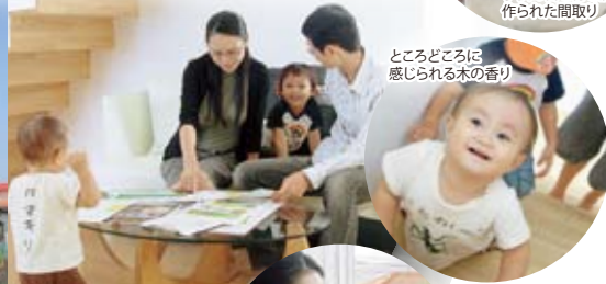
とこどころに感じられる木の香り